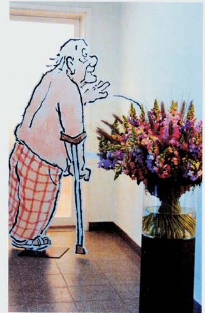
Eingang zur functiomed: Auch wenn man am Stock kommt, die freundliche Begrüssung durch die Mitarbeiterinnen und Mitarbeiter bewirkt bereits die erste Besserung.

Nicht alles lässt sich mit Osteopathie allein behandeln. Ein Zusammenwirken verschiedener therapeutischer Disziplinen wäre die optimale Lösung. Letztlich entscheiden die Patienten. Und immer mehr tun dies zugunsten der Osteopathie und vor allem im Vertrauen auf die therapeutische Kunst von Nikolaus Greavu.